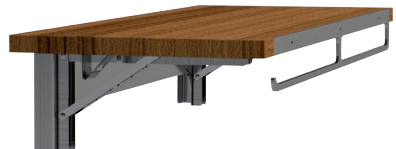
Sidekick Zusatzliche Arbeitsfläche*