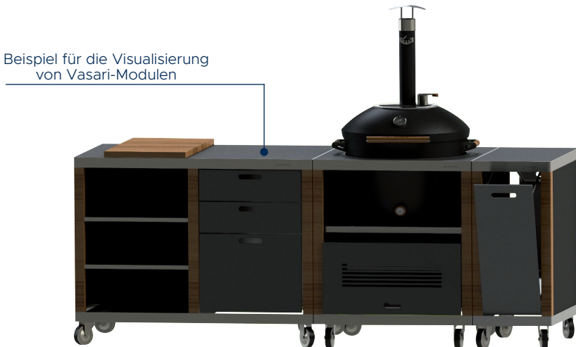
Masuria Vasari komplett mit Cargo*, Workstation* und Vasari Grill*